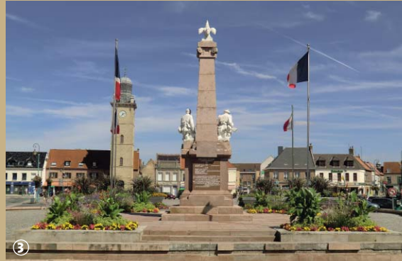
Beffroi et monument aux morts.

construction d'un chenal reliant la ville à la mer fut stoppée en cours de réalisation. En 1658, Gravelines tombe dans le camp français et Vauban se charge d'achever l'ouvrage. La place forte se singularise alors par son système hydraulique qui permet de réguler la profondeur du port, de curer le chenal et