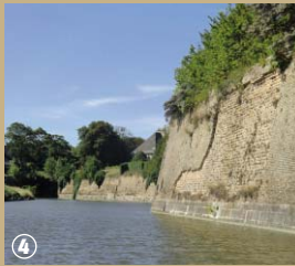
Fortifications vues des dunes.

en cas d'attaque d'inonder efficacement les abords de la ville. Ces temps belliqueux sont aujourd'hui révolus. Les fortifications