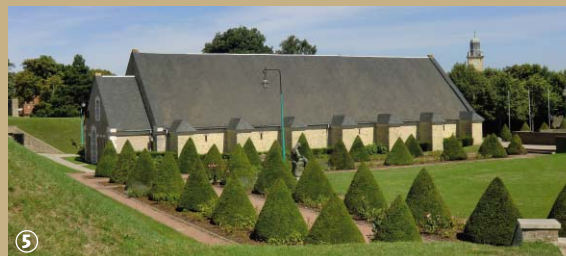
Musée du dessin et de l'estampe.

appartiennent au patrimoine historique de la ville et l'ancienne poudrière abrite désormais le Musée du Dessin et de l'Estampe originale.