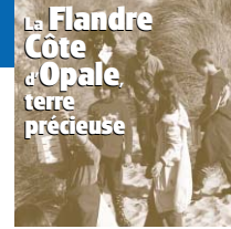
La Flandre Côte d'Opale terre précieuse