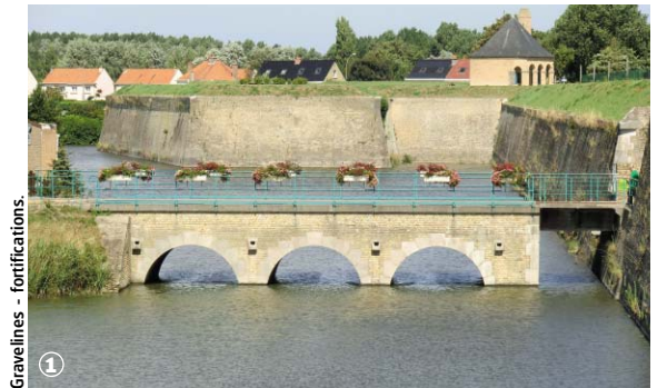
Gravelines - fortifications.

Randonnée Pédestre Gravelines, forteresse maritime : 4 km