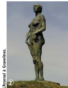
L'Arsenal à Gravelines.

Balisage bleu sur écusson rouge Carte IGN : 2302 Ouest