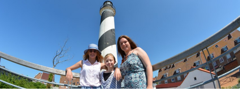
Le Phare de Petit-Fort-Philippe

116 marches à gravir pour un panorama exceptionnel !